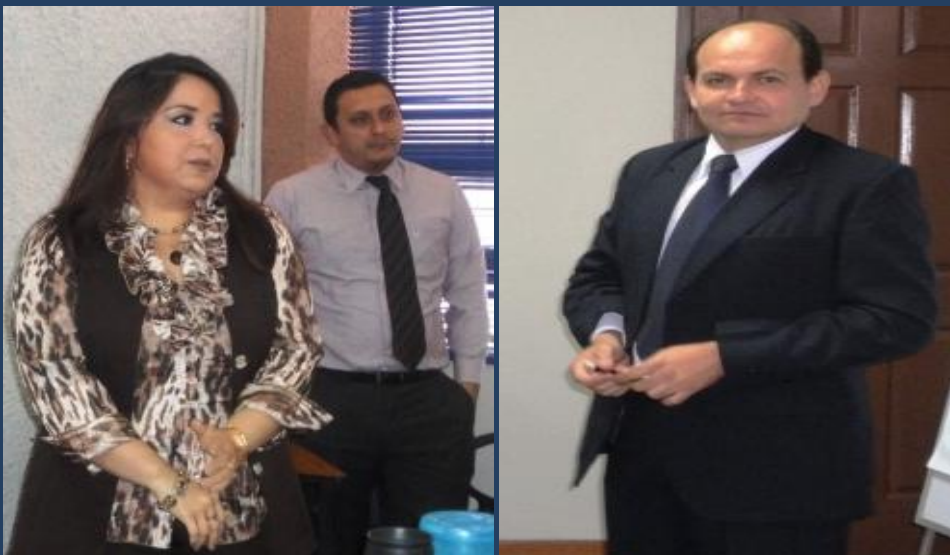
Expositores de la Dirección General de Aduanas.