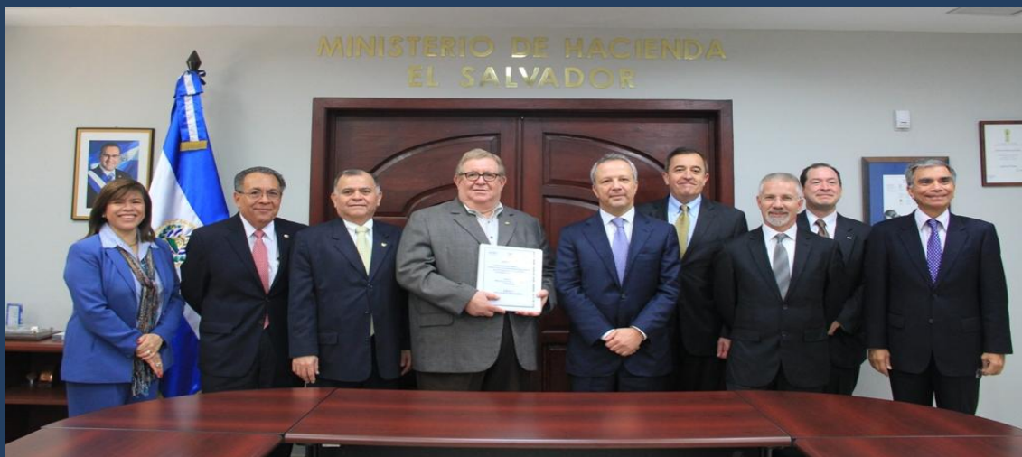
Titulares del Ministerio de Hacienda, junto a representantes de COTECNA-SMITH.