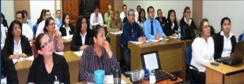
Funcionarios de la Corte de Cuentas de la República en la capacitación

Un total de 30 funcionarios de la Corte de Cuentas de la República fueron capacitados en temas aduaneros por personal de la Dirección General de Aduanas, durante el período del 8 al 12 de octubre de 2012.