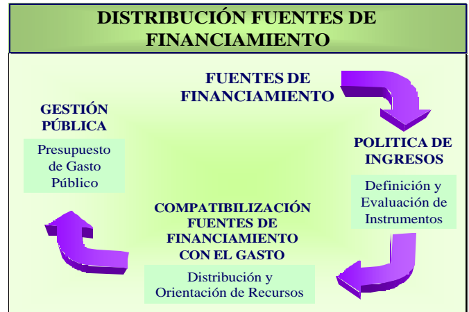
Ilustración No. 1

El proceso de determinación y distribución de las fuentes de financiamiento del gasto público, se puede definir así: