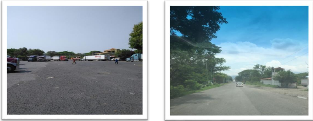
Fotografías de las áreas en las cuales se muestra el descongestionamiento y la presencia de las autoridades para mejorar la gestión vial y el control fronterizo.