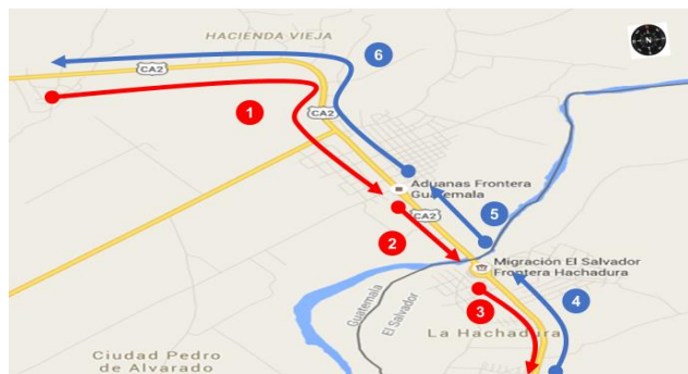
Ilustración 1ª Área de captura de información

Se analizaron aproximadamente 10,100 datos de unidades de transporte provistas de equipos GPS, que han sido recopilados por el Proyecto a través de acuerdos con actores claves. Los datos que se registran consideran datos de tiempos únicamente, no se registra información de: placa de la unidad de transporte, tipo de mercancías, números de documentos aduaneros, propietario de la unidad, entre otros.